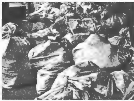
Resim 1: KAYTAM'a teslim alınan belgelerin çuvalar halindeki görünümü

Burada sunacağımız bilgiler koçanlardan (örnek bir orijinal koçan için bakınız Resim 2; yeni alfabeyle çevrilen koçanlardan yerli ve yabancı meslek sahipleri için bakınız Tablo 1 ve 2) 5.500 adet okunarak elde edilmiştir. Bunların sadece 1.350'sinde kişilerin mesleği belirtilmiş, diğerlerinde ise belirtilmemiştir.